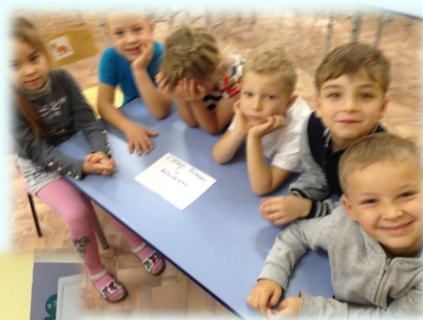
Команда «Супер коты и кошечки»